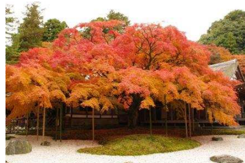
雷山千如寺大悲王院「大楓」

毎年9月になると、小学生を対象に7泊8日の通学キャンプが行われます（希望者のみ）。雷山いこいの家にテントを張り、そこから通学するという合宿で、子どもの自主性と協調性、忍耐力を養うことを目的としています。