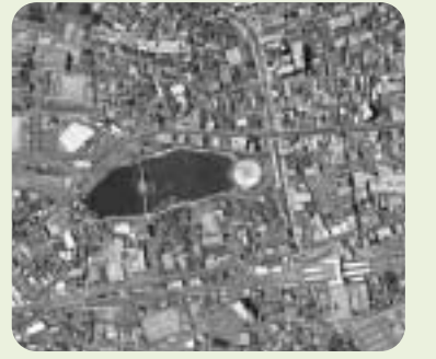
市役所周辺の航空写真

4月1日(木)から4月30日(金)まで 市では、平成22年度の固定資産の縦覧を、次のとおり行います。